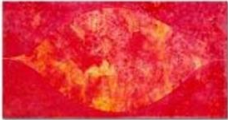
Autora: Tomie Ohtake Sem título Ano: 1991 Técnica: Acrílica sobre tela Dimensão: 205x375