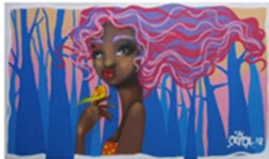
Autora: Crica Título: Proteja a Mata Ano 2018 Técnica: Spray sobre tela Dimensão: 120x200