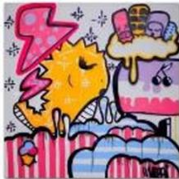
Autora: Mandy Sem Título Ano 2009 Técnica: Spray sobre tela Dimensão 180x180

Todas as atividades propostas para para a visita na exposição Elas fazem arte , possibilitarão uma experiência através de diferentes linguagens da Arte, construindo um lugar de relação e produção de sentidos. Para isso, apresentaremos uma abordagem conceitual e metodológica baseada na vida e obra das artistas presentes na exposição, bem como nas variadas dinâmicas propostas para atender as demandas específicas de cada grupo agendado.